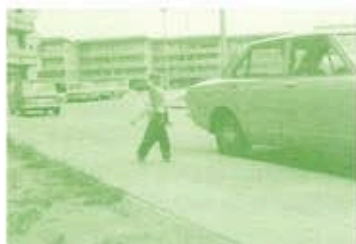
Fotoalbum Mevr. De Boeck

De Arenawijk is één van de merkwaardigste woonprojecten in Deurne. De woonbuurt werd opgetrokken op de gronden van 't Fortje' dat deel uitmaakte van de 19e-eeuwse fortengordel rond Antwerpen. De flatgebouwen werden in de jaren '60 ontworpen door de onlangs overleden Renaat Braem, een van de invloedrijkste modernistische architecten van ons land. Braem ontwierp voor de sociale huisvestingmaatschappij 'Deurnese Moderne Woning' een project met 249 appartementen bestaande uit een middenveld met vier grote woonbloktorens, omringd door lagere randbebouwing. Alleen de randbebouwing draagt zijn typische stijl. De hogere flats op het middenveld kwamen er pas in de jaren '80 ondanks protestacties van de bewoners.